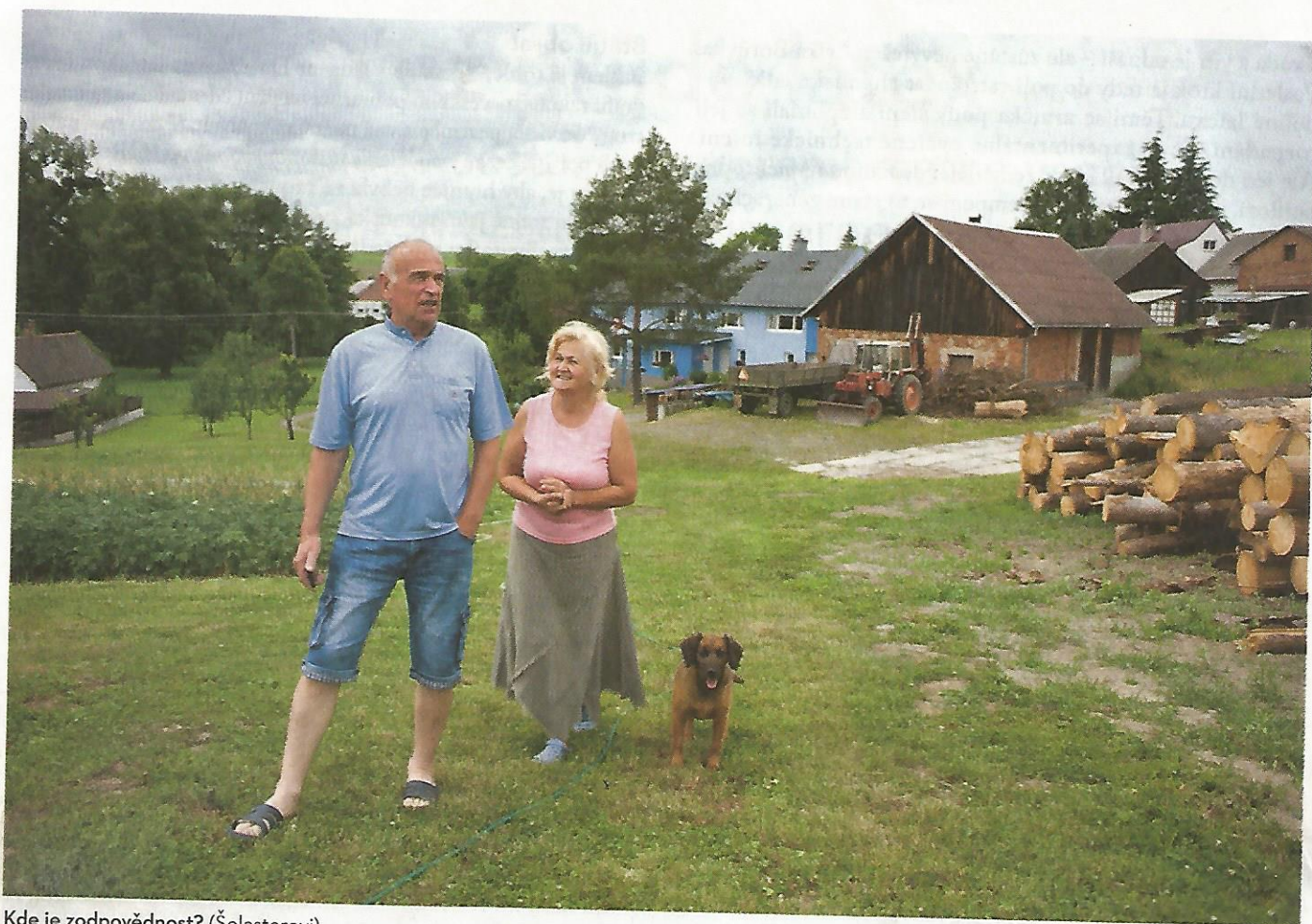
Kde je zodpovědnost? (Šolasterovi)

dosud ve své historii přišel. Jejich protierozní vyhláška představuje obrat v tom, jak se tuzemské úřady na péči o obhospodařovaná pole dívají.